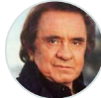
Artista: Johnny Cash Bar: Cadillac Jack's, Centerville, OH