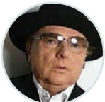
Artista: Van Morrison Bar: The Pub, Beavercreek, OH