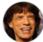
Artista: Rolling Stones Bar: Whistles Pub & Eatery, Scranton, PA

Los productos de TouchTunes cuentan con licencias otorgadas por las organizaciones de derechos de reproducción, así como por los sellos discográficos y compañías editoras, y generalmente cubren toda la música que se reproduce en el jukebox.