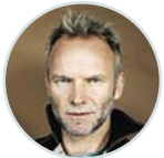
Artistas: Sting, Mick Jagger Bar: Boot Scoot n' Saloon, West Newton, PA

Demandas judiciales presentadas por reproducir música de un artista sin las licencias de uso apropiadas: